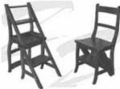
Library step chair